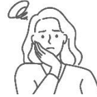
프로젝트 진행할 때마다 결정장애에 빠지는 PM