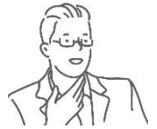
의사결정권자로서의 역할을 고민하고 있는 예비 리더