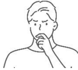
후회없는 의사결정 방법이 궁금한 리더